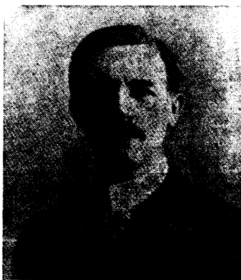
Aimé Cotton, jeune professeur.

magnétique des colloïdes, en particulier celle des suspensions colloïdales d'hydrate de fer dont Majorana avait mis en évidence les propriétés curieuses. Cette étude amena Cotton et Mouton à rechercher un autre phénomène que Faraday n'avait pas réussi à déceler, l'existence d'une biréfringence magnétique des liquides purs, contrepartie de la biréfringence électrique découverte en 1875 par Kerr. En associant les champs magnétiques élevés, obtenus grâce aux électroaimants désignés par Pierre Weiss, aux techniques polarimétriques très fines élaborées par Cotton, et en choisissant les liquides dont la biréfringence électrique avait été trouvée