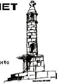
Lanterne des Morts